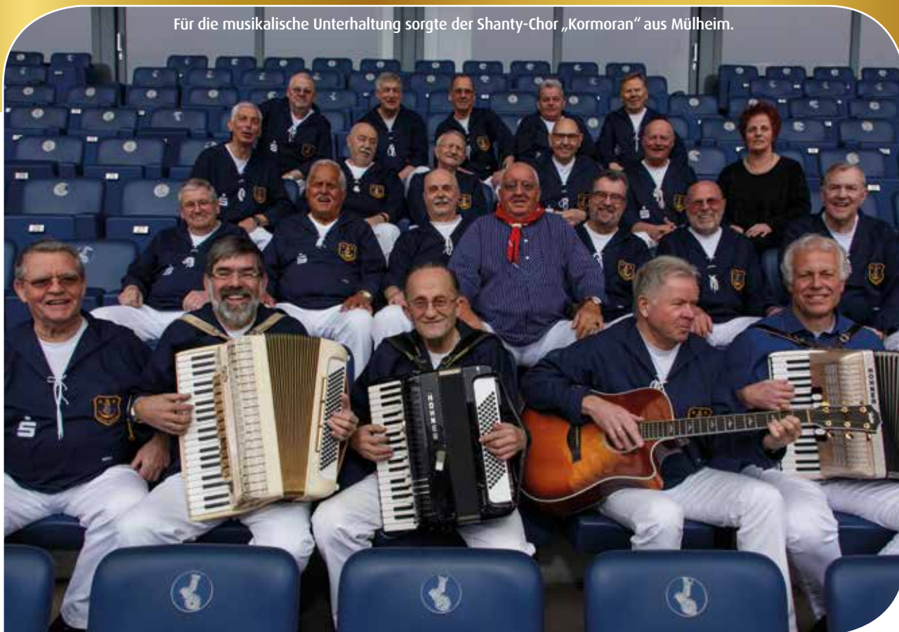
Für die musikalische Unterhaltung sorgte der Shanty-Chor „Kormoran“ aus Mülheim.

genheit, das die WoGe Ruhrgebiet seit Generationen seinen Mitgliedern und Mietern bietet. Die treuen Mieter hatten nach dem offiziellen Teil eine ganze Menge aus alten Zeiten zu erzählen. Vor allem wurde auch eine ganze Menge gelacht, so dass alle Beteiligten einen wunderschönen Nachmittag im Kreise der WoGe verbringen konnten.