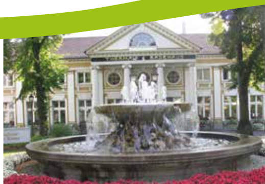
AUSFLUG | FAHREN SIE MIT NACH BAD NEUENAUH SEITE 7