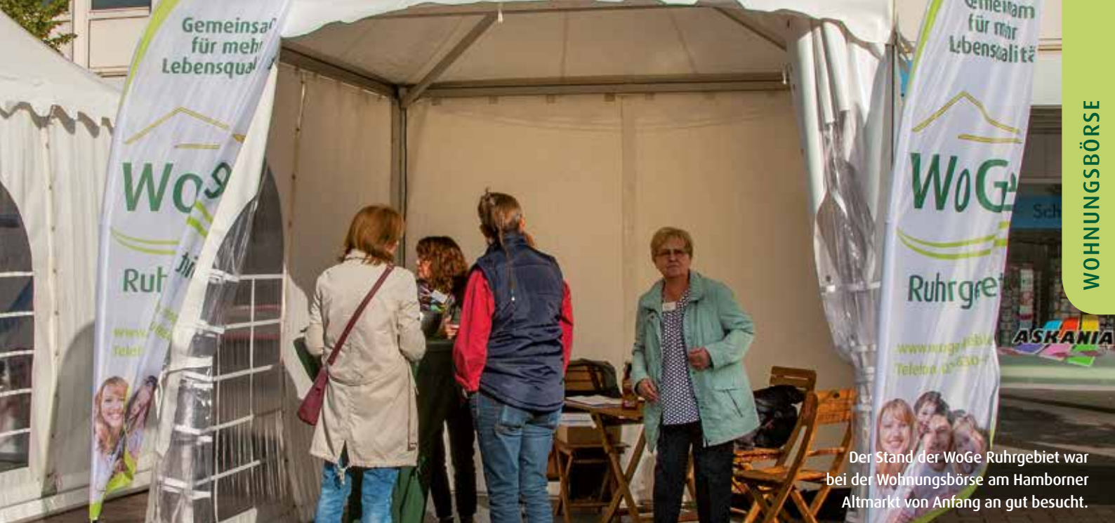
Der Stand der WoGe Ruhrgebiet war bei der Wohnungsbörse am Hamborner Altmarkt von Anfang an gut besucht.

WoGe Ruhrgebiet wieder mit einem Stand dabei