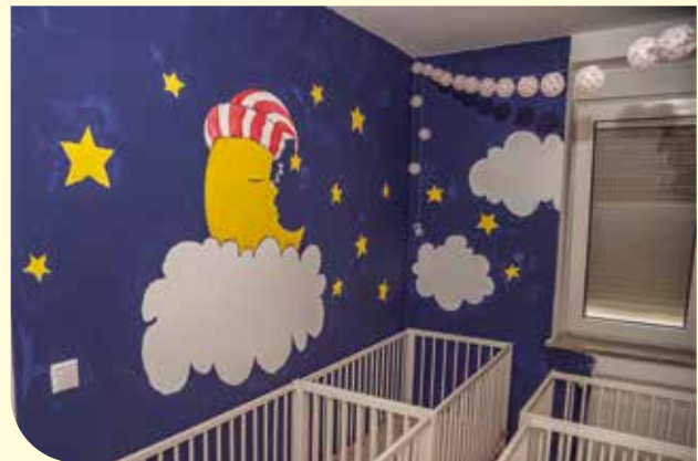
Nachdem Mittagessen geht es dann ans Schlafen, was nicht alle Kleinen wirklich lieben.

demal 7 Minuten, ins Zentrum Meiderichs kommt man zu Fuß (rund 12 Minuten) oder bequem mit dem Fahrrad (6 Minuten). Wer nicht mehr so agil ist, kann auch den Bus der Linien 909 und 909E nutzen. Die Haltestelle heißt nicht nur Gerhardplatz, sondern liegt auf der Lösörter Straße direkt neben dem Spielplatz. Nach Angaben der Duisburger Verkehrsbetriebe ist man von hier in rund drei Minuten an der Haltestelle Meiderich-Bahnhof und damit im Herzen des Stadtteils. Wer hier umsteigt, erreicht die City von Duisburg in weiteren 9 Minuten mit der U-Bahn.