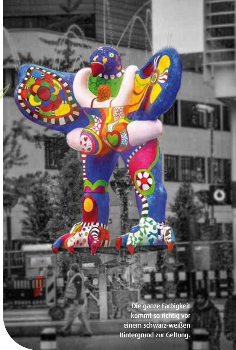
Die ganze Farbigkeit kommt so richtig vor einem schwarz-weißen Hintergrund zur Geltung.

Von der „Frau am Fluss“ geht es auf der Mülheimer Straße mit der Unterquerung der Bahnleise Richtung Innenstadt wei-