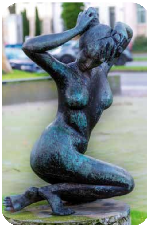
Die Skulptur „Frau am Fluss“ besticht mit einer solchen Lebendigkeit, dass man sich die junge Dame gut badend am Fluss vorstellen kann.

deutlich erkennbaren Brüsten, Scham und wallendes Haar sichtbar. Bereits im Jahr 1950 wurde sie geschaffen. 1962 wurde die Skulptur dann von der Sparkasse erworben. Seit dieser Zeit gehört sie zu den bekanntesten und beliebtesten Kunstwerken im öffentlichen Raum. Dabei steht die Bronze-Skulptur an einem geschichtsträchtigen Ort, denn an dieser Stelle stand bis 1958 die Villa des ehemaligen Oberbürgermeisters Karl Lehr. Hier zog dann später die städtische Kunstsammlung ein: Einem Vorgänger-Museum des Wilhelm-Lehmbruck-Museums.