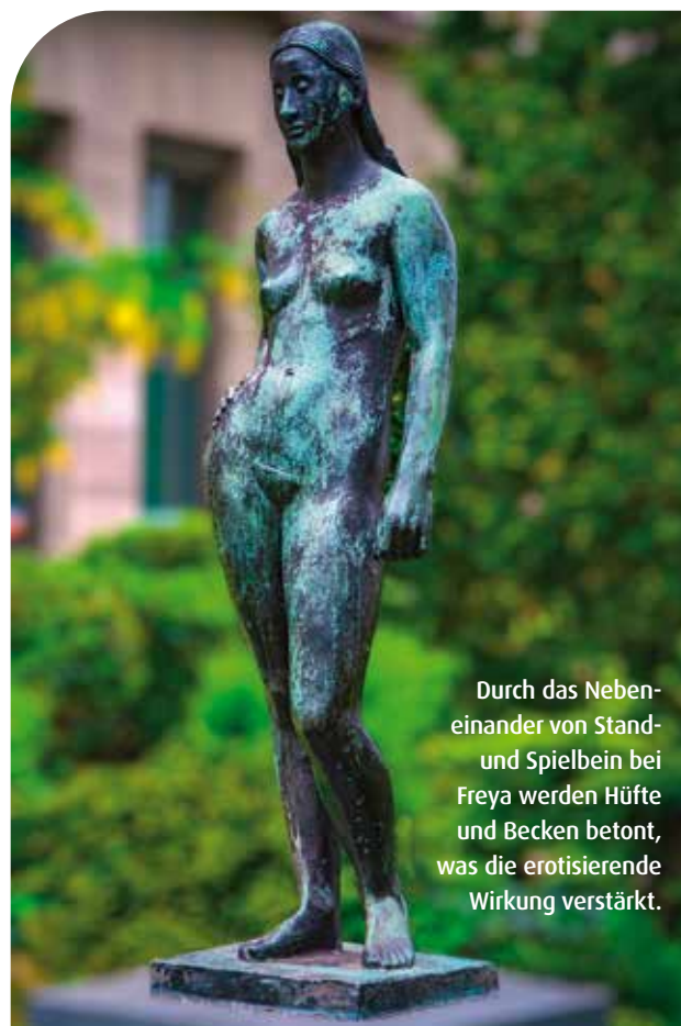
Durch das Nebeneinander von Stand- und Spielbein bei Freya werden Hüfte und Becken betont, was die erotisierende Wirkung verstärkt.

im Französischen steht „Nana“ für moderne, selbstbewusste, erotische und auch verruchte Frauen. Niki de Saint Phalle sah